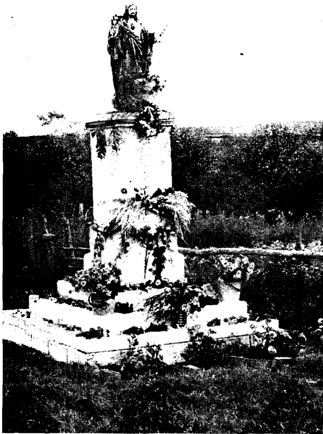
Figura Chrystusa w Lucimiu, udekorowana na Święto Plonów, 1983 r.