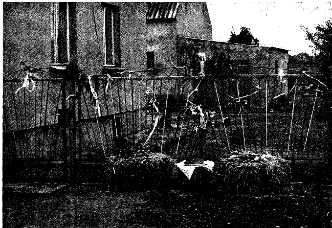
Dekoracja plotu i bramy, Dożynki, Lucim 1983 r.

żeby upiększyć wieś, ale rzucali ziarna do zamrożonej ziemi, bo ustalili datę sadzenia, jak datę spektaklu, nie licząc się z pogodą. Oczywiście, nie wyrosły. Choć potem te słoneczniki wracają, np. w dekoracjach plotów w czasie dożynek.