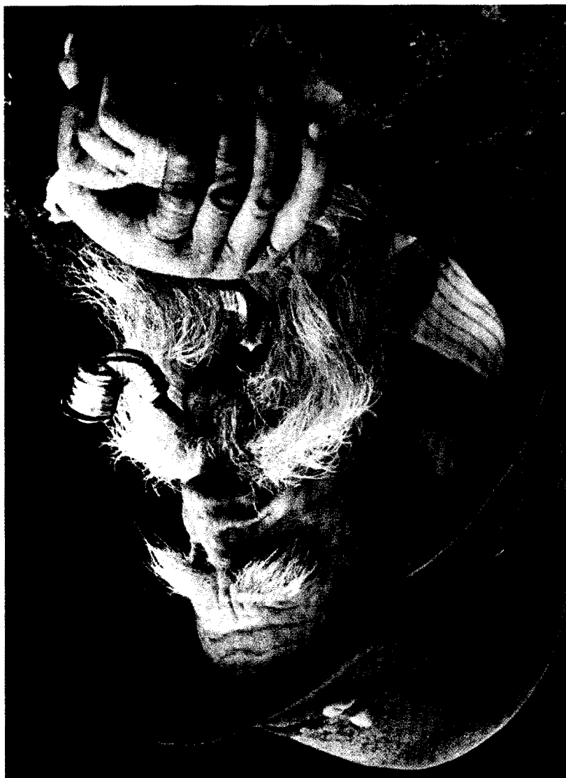
Stary pasterz z Żębu