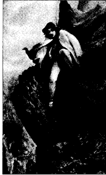
Ryc. 2. Aleksander Kotsis, „Kłusownik”

Dla celów badań wybrałem te wartości, wokół których może, choć nie w takim samym stopniu dla obu porównywanych grup, kształtować się poczucie świadomości tożsamości badanych ludzi. Należy zaznaczyć, że żadna z wybranych wartości nie występuje samodzielnie w kontekście tożsamości badanych zbiorowości. Działania badanych jednostek wskazują na odniesienie się w nich do całego grupowego systemu ideologicznego lub, w razie jego braku, do ogólnego kontekstu kultury, w jakim zostało podjęte działanie, nie zaś do konkretnej wartości centralnej. Stąd wzajemne prze-