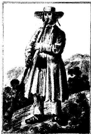
Pastuch z gór w Sanockiem