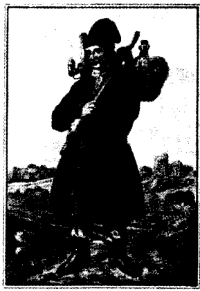
Wiśniak od Buczacza (Podole)