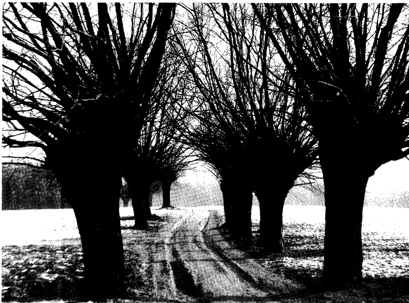
Wierzy w Murzynowie