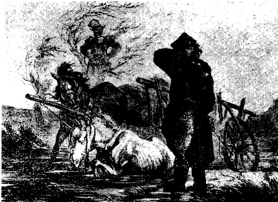
Boruta w starej wierzbie.

71 10 lat za dęby, „Gazeta Wyborcza”, nr 291, 14–15 grudnia 1991