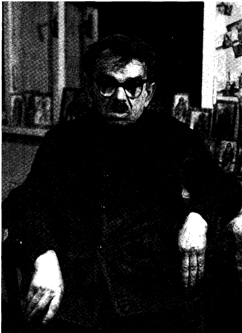
Jedno z ostatnich zdjęć Nikifora. Stary, zmęczony, schorowany miał już to, o czym dawniej marzył — dom, samochód, radio, zegarki — ale nie umiał się już tym cieszyć