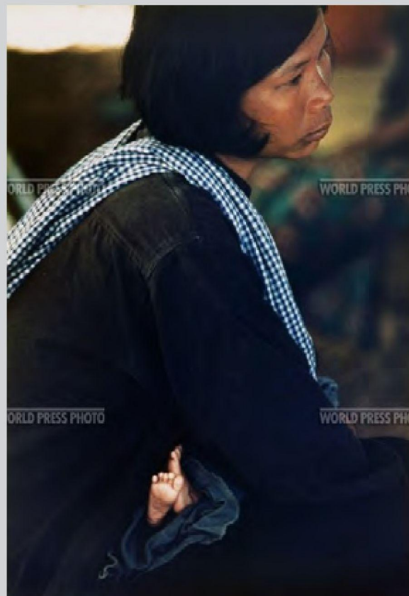
fot. 11. David Burnett, Zdjęcie roku 1979