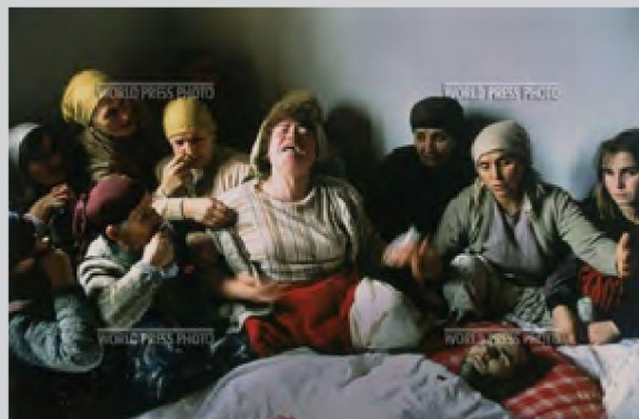
fot. 9. Georges Merillon, Zdjęcie roku 1990