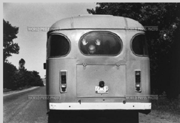
fot. 2. Lucian Perkins, Zdjęcie roku 1995