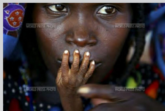
fot. 12. Finbarr O'Reilly, Zdjęcie roku 2005