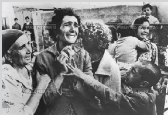
fot. 6. Don McCullin, Zdjęcie roku 1964