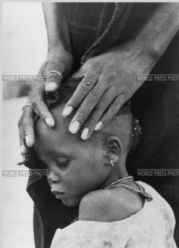
fot. 10. Ovie Carter, Zdjęcie roku 1974