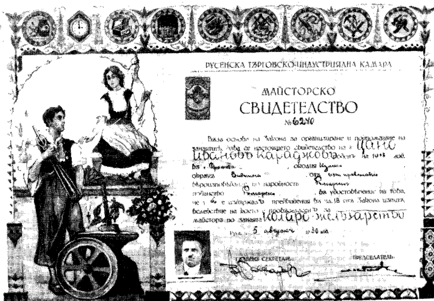
Ryc. 3. Świadectwo majsterskie wydane w 1930 r. przez Izbę Przemysłowo-Handlową w Russe