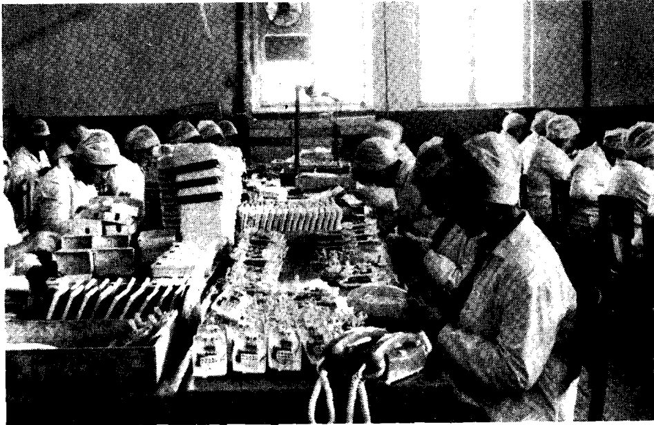
Ryc. 7. Oddział montażowy Fabryki Sprzętu Telekomunikacyjnego