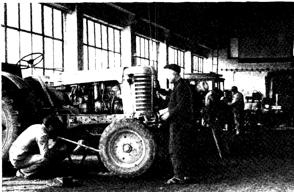
Ryc. 6. Warsztat mechaniczny TKZS