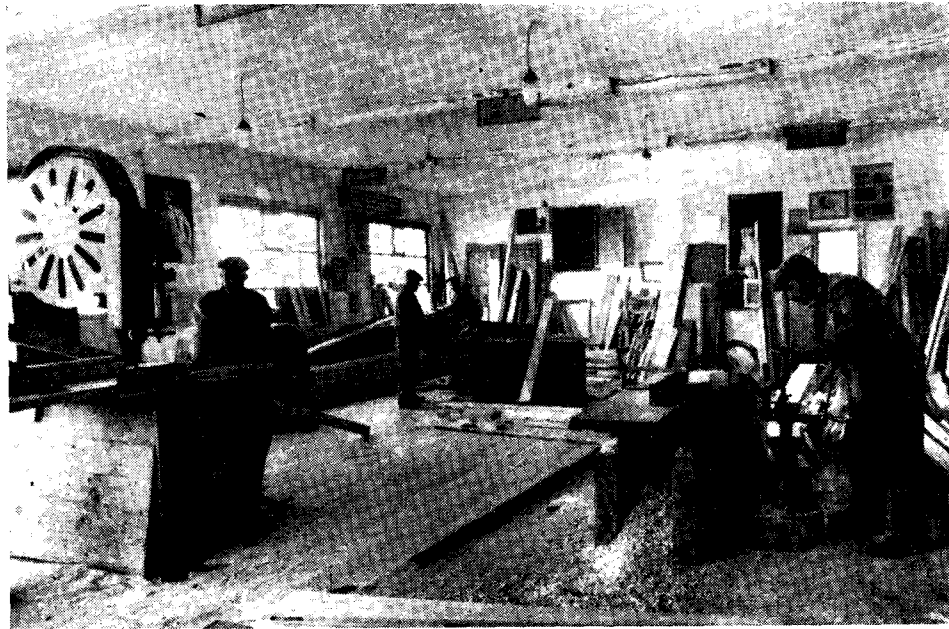
Ryc. 4. Pracownia stolarska TPK