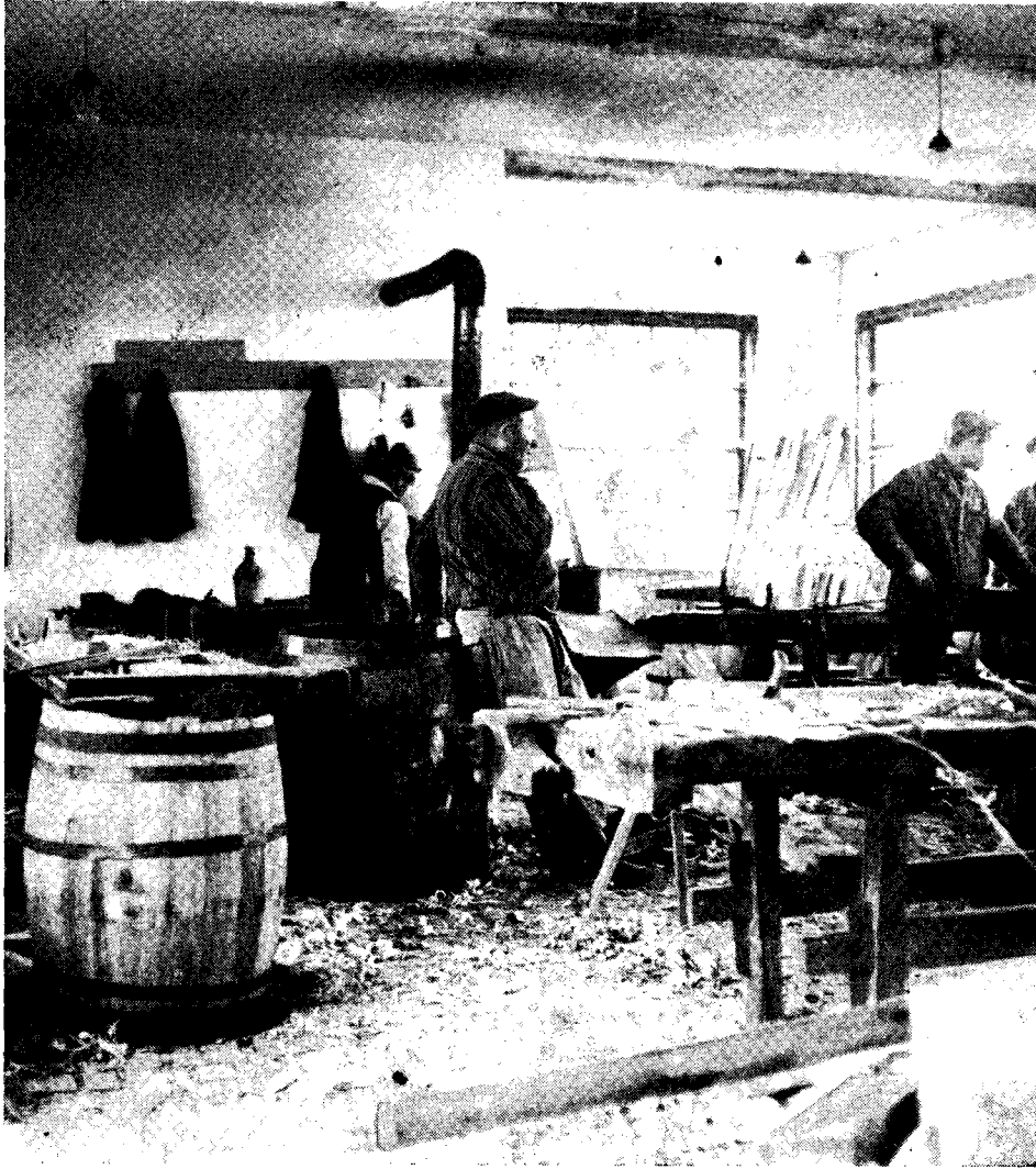
Ryc. 5. Pracownia bednarska TPK