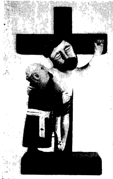
St. Dużyński, Św. Franciszek pod Krzyżem

je na wyroby sztuki ludowej, które wynoszą 90% całego obrotu.