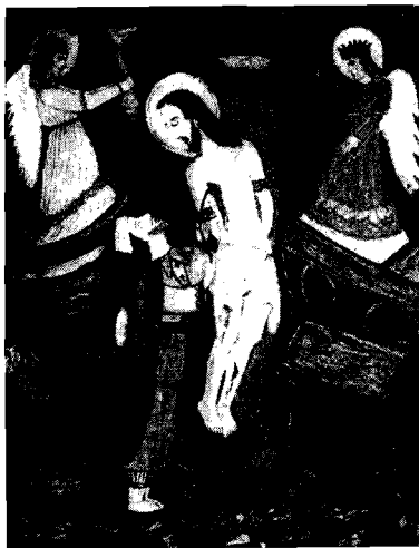
K. Wiśnios, Chrystus u słupa , Akwarela

Rewelacją wystawy było odkrycie ciekawego malarstwa Katarzyny Wiśnios.