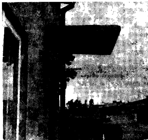
Il. 9. Gryfy z cygańskiego wozu jako ozdoba wejścia do domu, Warka, 1980 r.