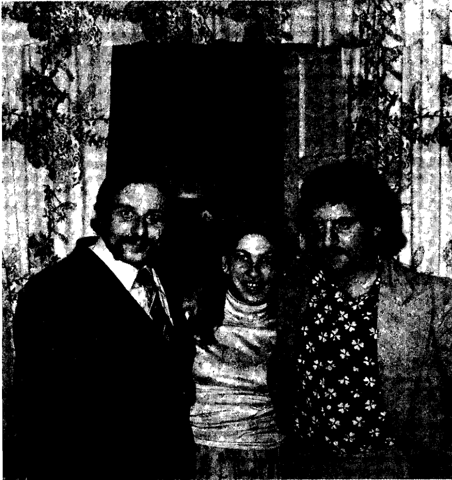
Il. 8. Cyganie z grupy Lowari, Polska, 1979 r.

należałoby podkreślić dbałość o czystość podczas sporządzania posiłków. Mycie i płukanie produktów żywnościowych odbywa się w przeznaczonych tylko do tego celu miskach. Również ściśle przestrzegane jest oddzielne pranie ubrań mężczyzn i kobiet. Takie postępowanie podyktowane jest niebezpieczeństwem tabuicznego skalania, wynikającego z nieczystości fizjologicznego dołu kobiety. 16