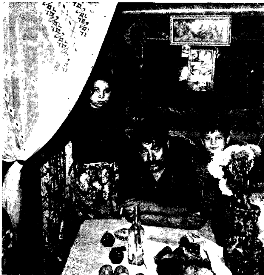
Il. 7. Wnętrze wozu, Cyganie z grupy Polska Roma, 1979 r.

ne z gałęzi i liści. Od wieku XV stopniowo zaczynają się rozpowszechniać namioty, których forma została przejęta prawdopodobnie od ludów europejskich. 10 Uniwersalność formy namiotów z pewnością w znacznym stopniu przyczyniła się do ich popularności wśród Cyganów — pozwalająca na swobodne dostosowanie się do otaczającego środowiska geograficznego i kulturowego. Na przełomie XVIII i XIX w. członkowie niektórych grup cygańskich zaczęli kupować wozy od ludności osiadłej. W tym okresie używali je tylko jako środki transportu, mieszkali bowiem nadal w namiotach rozbijanych na postojach. Dopiero przełom XIX i XX w. zapoczątkował wykorzystywanie wozów w charakterze mieszkań 11 , głównie przez bogatsze grupy np. Lovara czy Kelderasza. „W oknach zawieszano firanki, na ścianach fotografie członków rodziny, barwne ilustracje z czasopism i obrazki święte — choć te rzadziej. (...) Tylna część wozu służyła do spania, tam też znajdowała się odzież, pościel itp. — niekiedy wstawiano tam szafę. W części przedniej toczyło się życie w ciągu dnia, tutaj jadano w czasie niepogody, gotowano na piecyku, którego komin wychodził przez otwór w dachu.” 12 Do systematyki mieszkań cygańskich poza namiotami, wozami i budynkami można dodać jeszcze np. jaskinie zamieszkiwane przez hiszpańskich Gitanos w Granadzie i Kordowie. 13