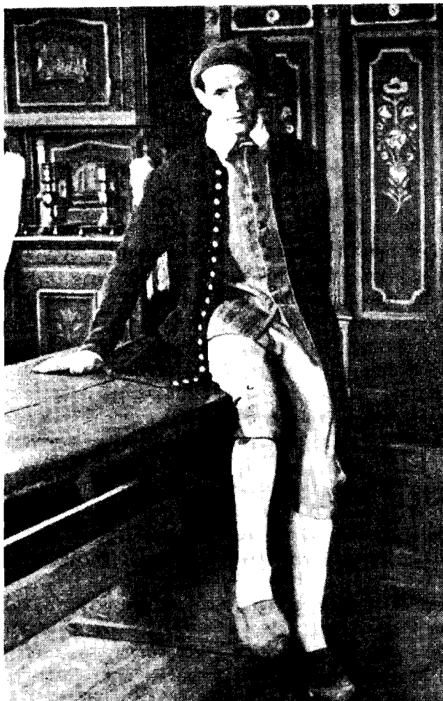
Ryc. 3. Strój męski wieśniaka z Zelandii, z połowy XIX w. Dostrzec można również fragment wnętrza typowego dla czarnej izby, tzw. stue

miasto z targiem stawało się dla chłopów atrakcją kulturalną i wzorcem — tworzyły się przeto lokalne typy strojów.