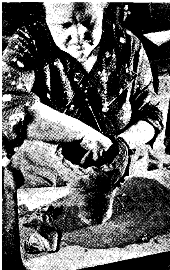
Ryc. 1. Modelowanie naczynia na desce trzymanej na kolanach. Przedstawiona tu czarna ceramika z zachodniej Jutlandii była wytworem kobiecym

Stopnie specjalizacji były różne. W regionach, gdzie ziemia była jałowa — rozwijało się rzemiosło. Podobne zjawisko występowało w latach głodu, kryzysu. Rzemiosło stanowiło wówczas dodatkowe, a nierzadko