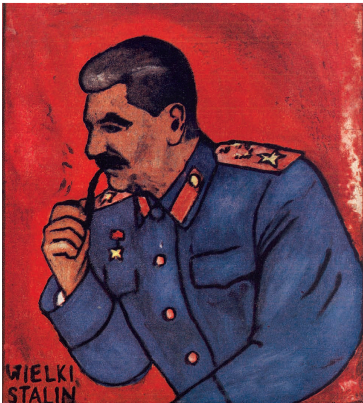
Wielki Stalin . Malarstwo na szkle. Wykonał Józef Hulka (Łękwica, pow. Żywiec). „Polska Sztuka Ludowa”, nr 2/1953

Ciekawym przykładem jest tu plakat Przyjaźń polsko-