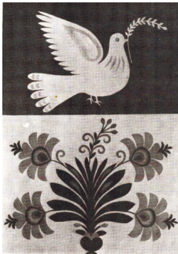
Naklejanka łowicka. Wyk. J. Wawrykowicz-Strycharska. Fot. St. Deptuszewski. „Polska Sztuka Ludowa”, nr 2/1953

z nieprzyzwoitymi określeniami wydawało się swoistą profanacją i gotowi byli raczej przesłać niedokładny meldunek, niż do niej dopuścić”. 48 Nawet samo miejsce, w którym dokonana się profanacja, autorzy meldunków taktownie nazywali „miejscem zamkniętym”.